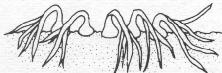
Figura 4 Recoja los bulbos de cebolla cuando los tallos principales se empiecen a caer.

Las cebollas se pueden recoger como cebollas verdes desde que estén como del tamaño de un lápiz hasta que empiecen a formar los bulbos. Para bulbos secos, deje que las plantas crezcan más grandes. La cebolla estará lista cuando el tallo principal esté lacio y se caiga. Vea la figura 4. El tamaño del bulbo no aumentará si le quiebra el tallo principal. Arranque las plantas de la tierra. Déjelas en la hortaliza por 1 ó 2 días para que se sequen. Después quíteles el tallo y las raíces y déjelas que se sigan secando en canastos o cajas.