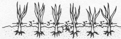
Figura 2 Siembre los trasplantes o "sets" a una profundidad de \frac{3}{4} de pulgada de hondo y como 3 pulgadas aparte.

trasplante la cebolla más hondo de 1 pulgada. Vea la figura 2.