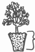
Coloque las plantas a esta profundidad. Asegúrese que la maceta esté cubierta.

Cuando coloque las plantas que estén en macetas de musgo de pantano cubra toda la maceta con tierra. Estas macetas expuestas al aire, extraen la humedad de las raíces de la planta. Vea la figura 4.