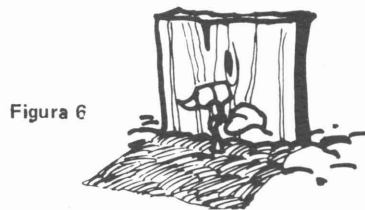
Pedazo de madera o tejamanil.

Las plantas colocadas en la hortaliza, tarde en el verano, para producir una hortaliza del otoño necesitarán alguna protección del sol. Un tejamanil, un cartón u objeto similar colocado al lado oeste de la planta proveerá sombra. Vea la figura 6.