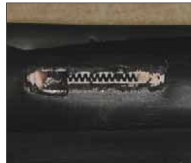
Figura 4. Gotero tapado por óxidos de manganeso.

Es difícil eliminar estas bacterias, pero se pueden controlar inyectando cloro en