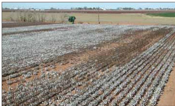
Figura 3. (Superior) Cultivo de algodón mostrando estrés hídrico debido al taponamiento de los goteros (Inferior). Las inyecciones de ácido podrían ayudar a reducir el taponamiento para que los terrenos puedan ser regados uniformemente.