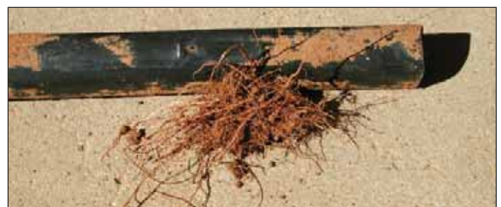
Figura 5. Raíces penetrando el gotero.

Es importante evitar que las raíces de las plantas penetren en los emisores de goteo (la Fig. 5 muestra un problema de intrusión de raíces). El Metam Sodio y el Treflan son dos compuestos que controlan