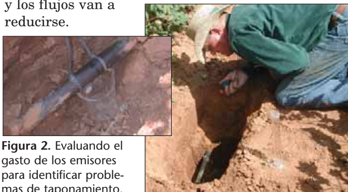
Figura 2. Evaluando el gasto de los emisores para identificar problemas de taponamiento.

Una manera de evaluar los problemas de taponamiento es colocar un recipiente debajo de algunos emisores como lo muestra la Figura 2. La cantidad de flujo de los emisores (volumen dividido entre el tiempo) recolectada en los distintos sitios debe de ser comparada con la cantidad de flujo especificada en el diseño. La parte superior de la Figura 3 muestra un campo en el cual las plantas se encuentran bajo estrés debido a que los emisores están tapados por óxidos de manganeso. La condición general de un sistema de goteo puede ser evaluada fácilmente al examinar frecuentemente las presiones del sistema y las cantidades de flujo. Si se tapan los emisores, las presiones del sistema van a aumentar y los flujos van a reducirse.