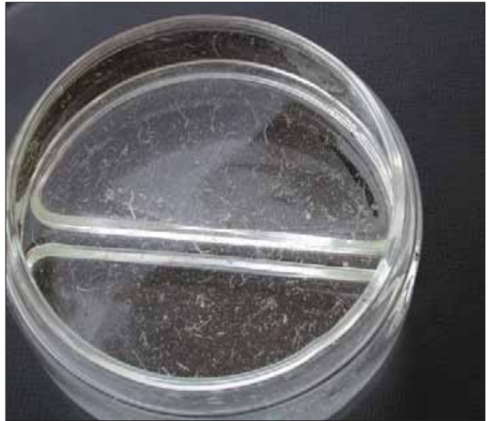
Figura 6. Gusanos arrojados del sistema de riego por goteo. El lavado de las líneas dos veces a la semana resolvió el problema.

Se cree que los huevos o los capullos de los gusanos fueron jalados hacia las líneas de goteo en las elevaciones más altas en el campo cuando se cerraron las válvulas de la zona. Una vez que estaban en las líneas de goteo, los gusanos salieron de los huevos y empezaron a crecer. Los gusanos y otros contaminantes fueron removidos durante los ciclos normales de lavado (cada 2 semanas).